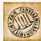
Cervia e Milano Marittima